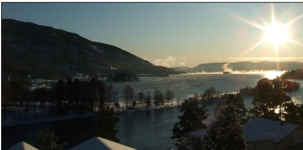
Sol over Norsjø, Akkerhaugen

Dersom vi skal lykkast med å gjere Telemarkskanalen til ein nasjonal og internasjonal attraksjon som kan gi ringverknadar for heile Telemark, må vi ta nye grep. Det kan vi få ved å etablere Telemarkskanalen som ein regionalpark.