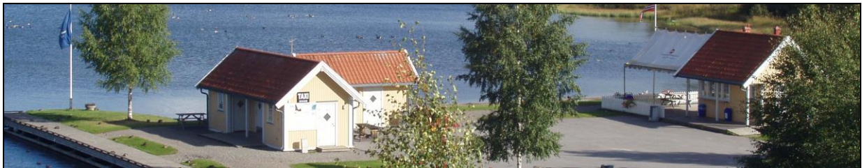
Ulefoss gjestebrygge