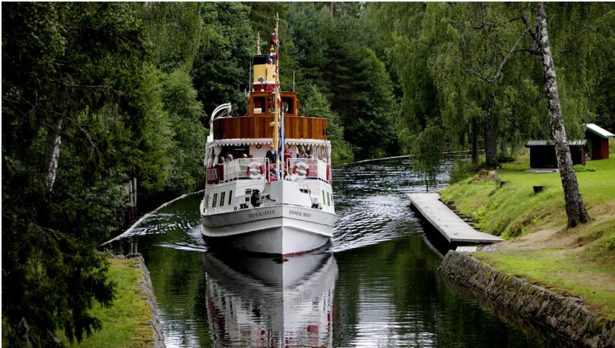
MS Henrik Ibsen, frå Kjellidal til Lunde

I tillegg vil ein regionalpark gi eit breiare perspektiv og ny dimensjon til utvikling av attraktive stader og lokalt næringsliv som kan auke bulyst og folketal i området.