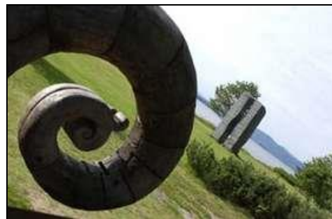
Skulpturparken Patmos på Akkerhaugen