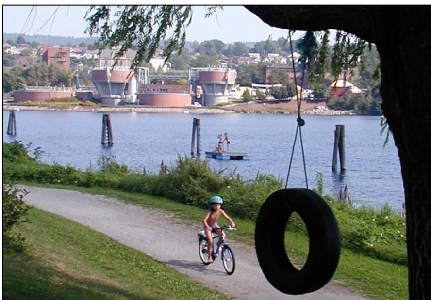
Bakkestranda i Skien

Styremedlemmene får møtegodtgjørelse i henhold til det til en hver tid gjeldende reglement for godtgjøring i Telemark fylkeskommune.