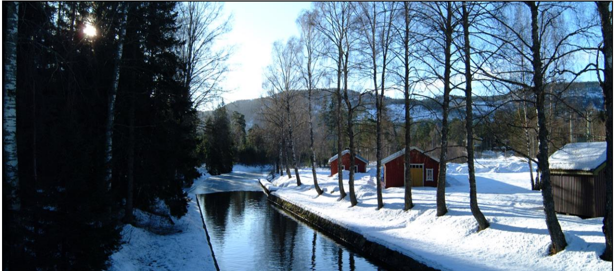
Hogga sluse, foto Jørn Steen

Regionalparken skal mobilisere og vitalisere ressursane knytte til kanallandskapet, og regionalparkens organisasjon skal vere pådrivar, koordinator og nettverksbygger for å få dette til