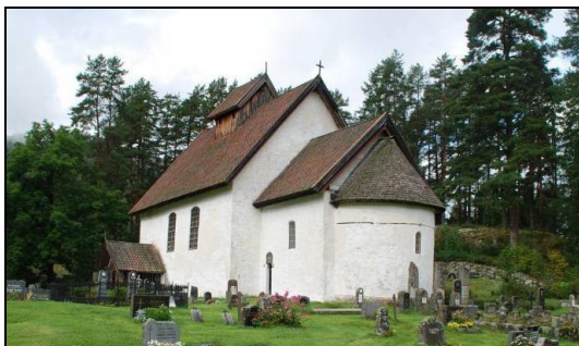
Kviteseid gamle Kyrkje

Viktige samarbeidspartnarar: Innovasjon Noreg Telemark, dei regionale næringssekskapa, næringsapparatet i kommunane, Telemarksreiser AL, dei lokale destinasjonsselskapa, Riksantikvaren, Telemarkskanalen FKF