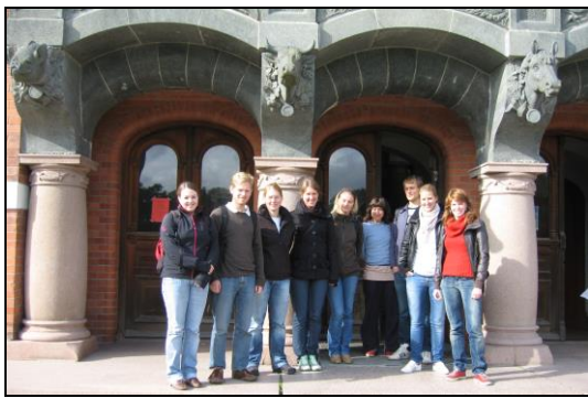
Studentar på veg til kanalen

Viktige samarbeidspartnarar: Det nasjonale nettverket for lokale og regionale landskaps-parkar, Kommunal- og moderniseringsdepartementet, Landbruks- og matdepartementet