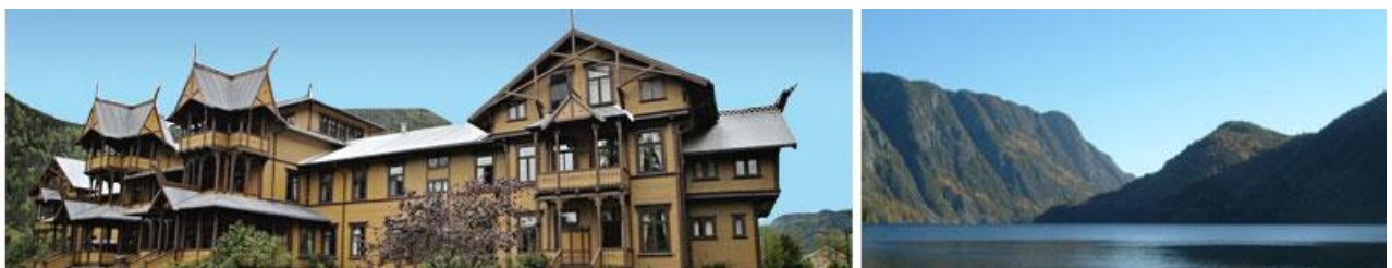
Dalen Hotell og Bandak

Frå boka Ved Flåvann danser alvene , utgitt at Telemark Forfatterlag i 1992, etter ein lyrikk-konkurranse i samband med at Bandakkanalen var 100 år.