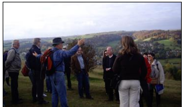
Studietur, Walking the land