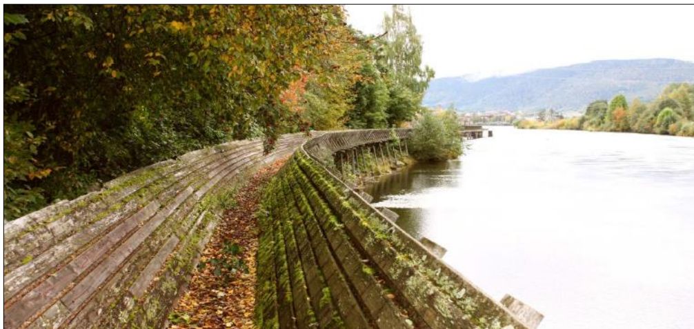
Tømmerrenna på Notodden