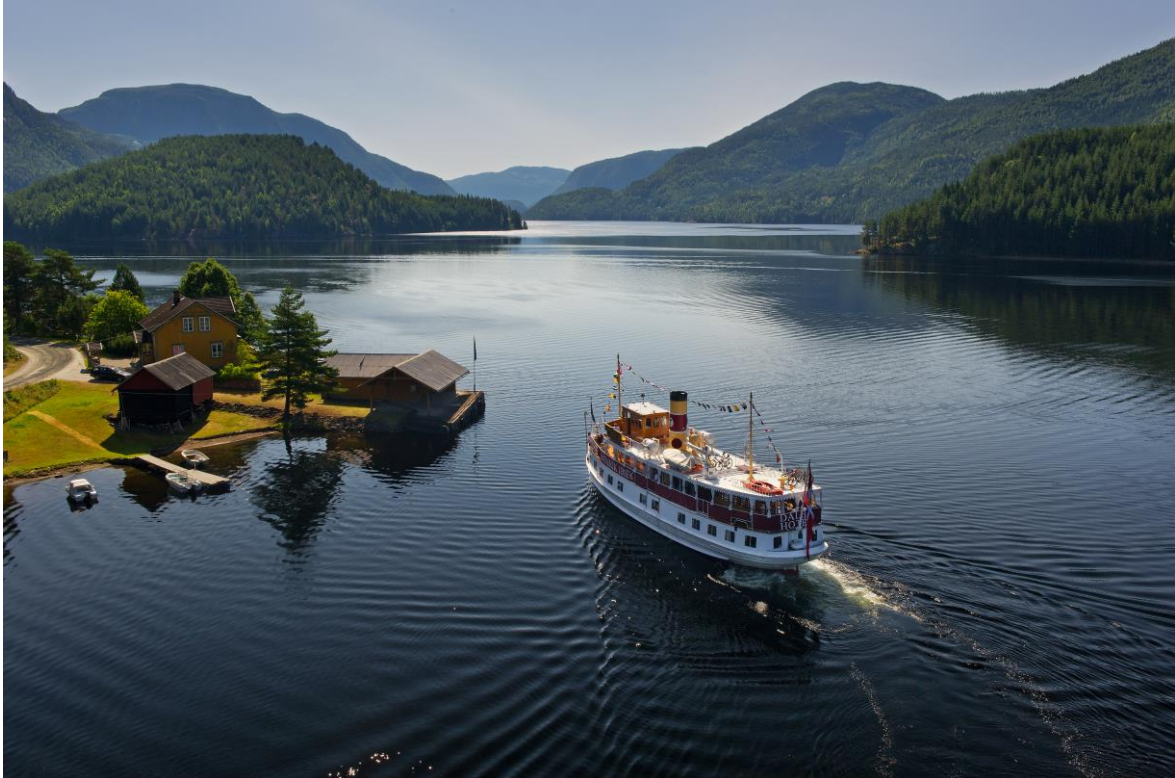
Spjotsodd brygge, Kviteseid