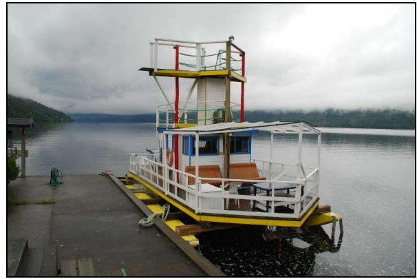
Lårdals ark