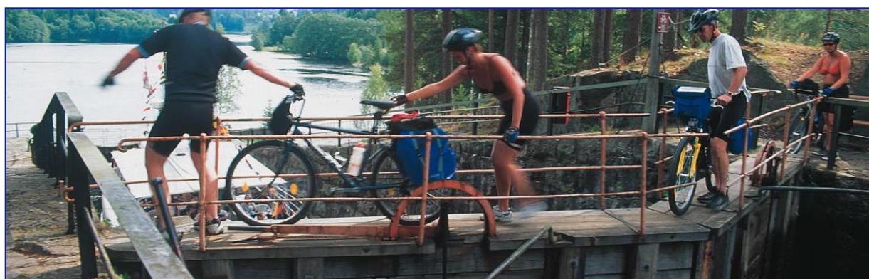
Eidsfoss sluse